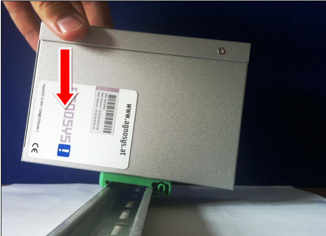
Montage auf der Hutschiene