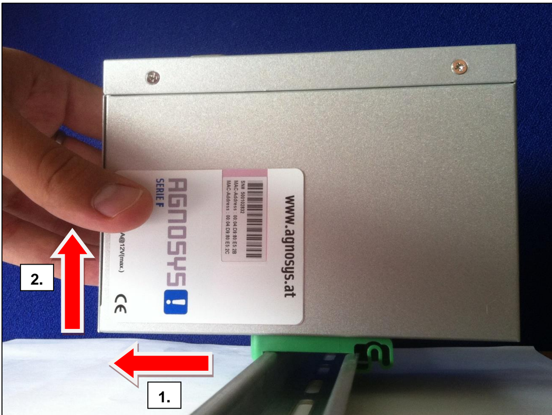
Demontage von der Hutschiene